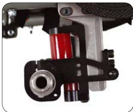
Asplaat met vering.