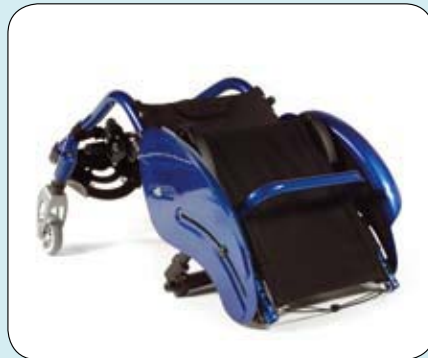
Open frame ontwerp.