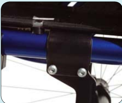
Traploos instelbaar zwaartepunt.