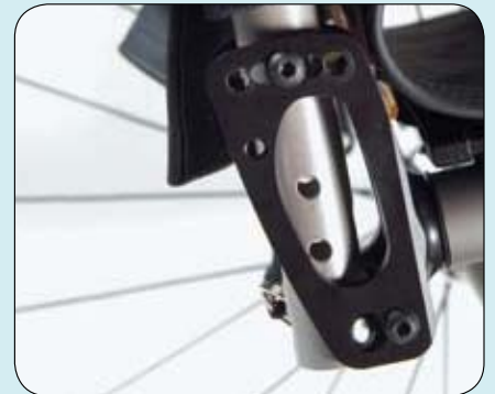
Innovatieve rughoekinstelling -12° tot +8°.