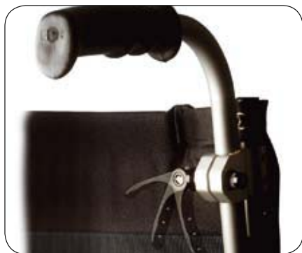
In hoogte verstelbare duwhandvatten.