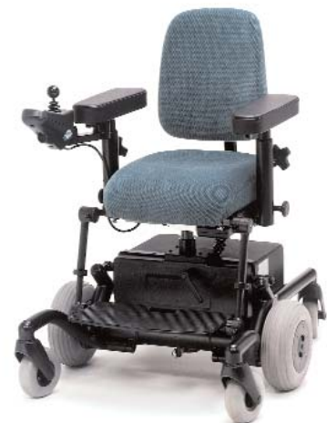
Aangepast voor kinderen met Medic beensteunen

REAL 6100 is getest en goedgekeurd door Hjälpmedelsinstitutet (HI) Zweden