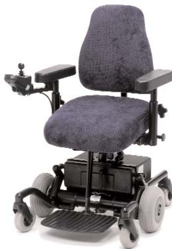
Elektrische zit- en rughoekverstelling