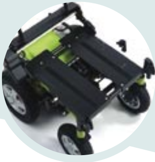
Breedte en diepte instelbare basis van het systeem