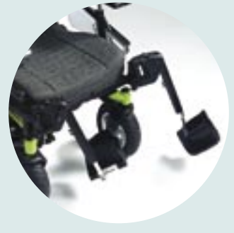
In hoek instelbare beensteunen, naar binnen en buiten wegzwijkbaar