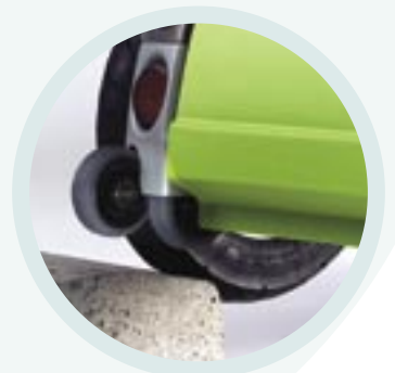
Dubbele anti-tip wielen voor stabiliteit en het nemen van stoepen